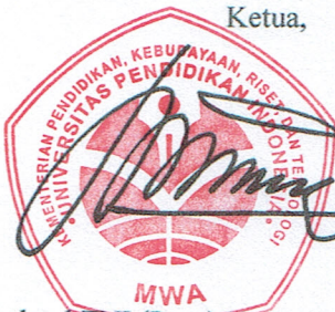
Jenderal TNI (Purn) H. Agum Gumelar, M.Sc.