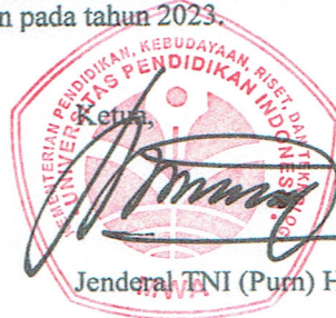
Jenderal TNI (Purn) H. Agum Gumelar, M.Sc.